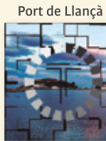
Port de Llançà