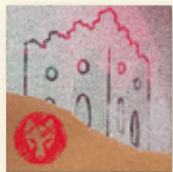
Vila de Llançà