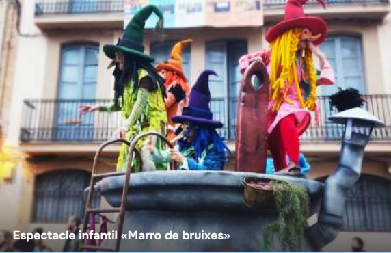
Espectacle infantil «Marro de bruixes»