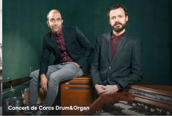
Concert de Corcs Drum&Organ