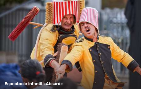
Espectacle infantil «Absurd»