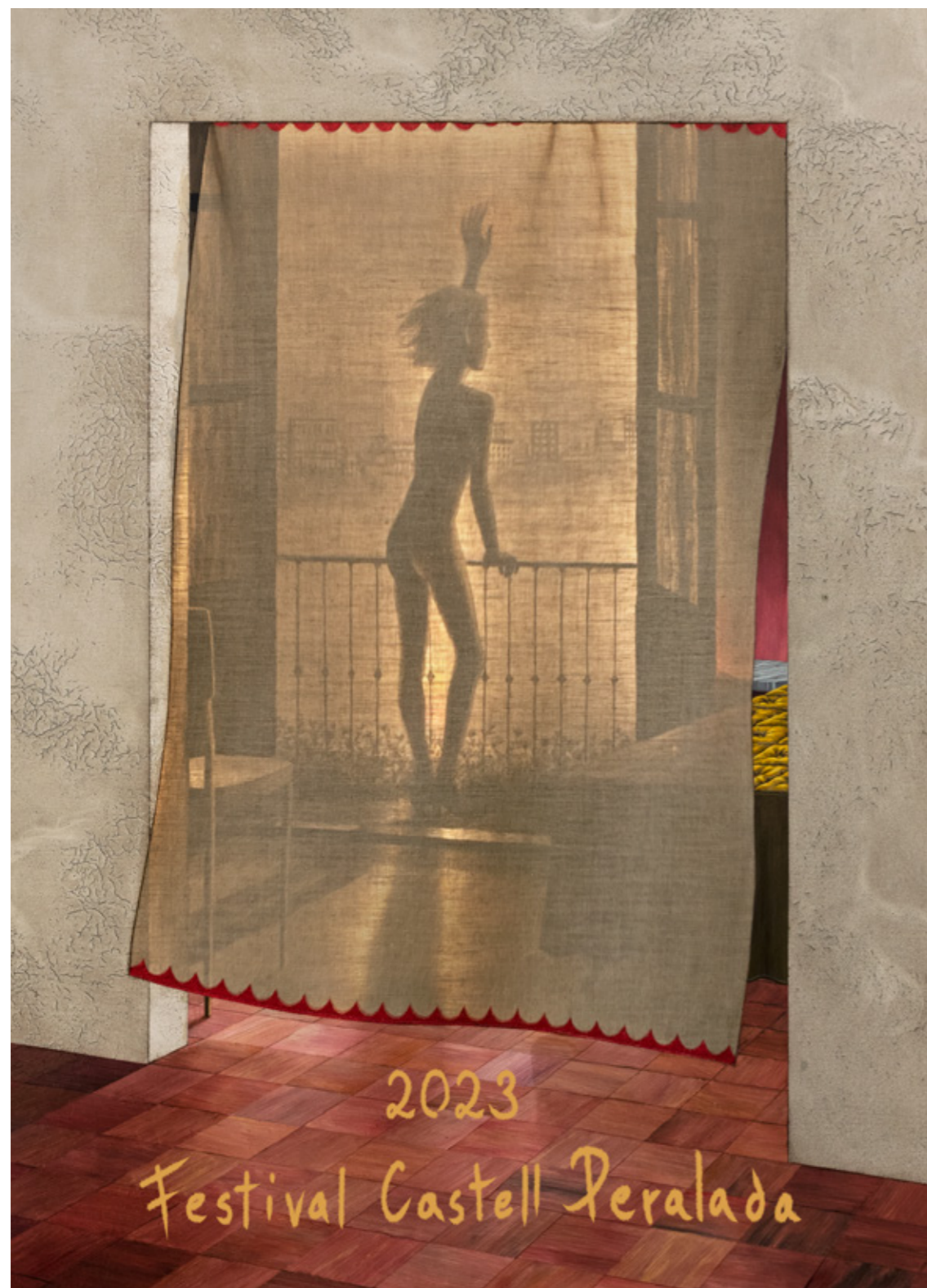
Cartell del Festival Peralada 2023: La Despedida ©Gino Rubert.